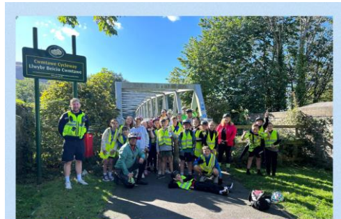
Taith Feicio Noddedig ar gyfer Sefydliad Jacob Crane 26/9/25