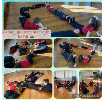
Gemau gyda menter iaith heddi

Diwedd Tymor : End of Term Gwyliau Pasg : Easter Holidays 30.3.26