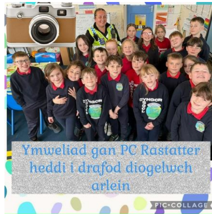
Ymweliad gan PC Rastatter heddi i drafod diogelwch arlein